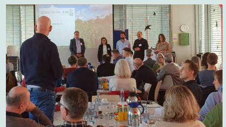
Links: Struvitfällungsreaktor des Abwasserverbands Braunschweig; oben rechts: Struvitgranulat der SF-SoepenberGmbH; Mitte rechts: mit Struvitdünger versorgtes Maisfeld; unten rechts: Akteure im Dialog bei der Abschlussveranstaltung.